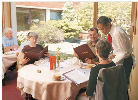
Le restaurant d'application, ouvert au public toute l'année. (fermeture en août)