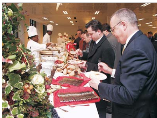
Banquet organisé par l'école pour les "Amis du Beaujolais"

D es stages en entreprises viennent compléter l'enseignement dispensé à l'école. Ils assurent le lien entre l'école et la réalité du monde professionnel. Chaque élève, quelque soit le cursus choisi, doit au cours de sa scolarité faire un ou plusieurs stages en entreprises. Pour ceux qui choisissent la voie de l'alternance, les périodes en entreprises représentent la moitié du temps de formation. La direction de l'école prend en charge le placement des élèves en entreprise.